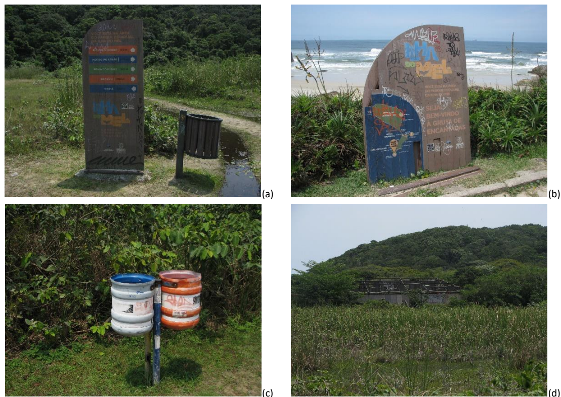
Figura 6: Equipamentos observados nas trilhas (a, b, c) e situação da edificação da Praça de Alimentação (d).