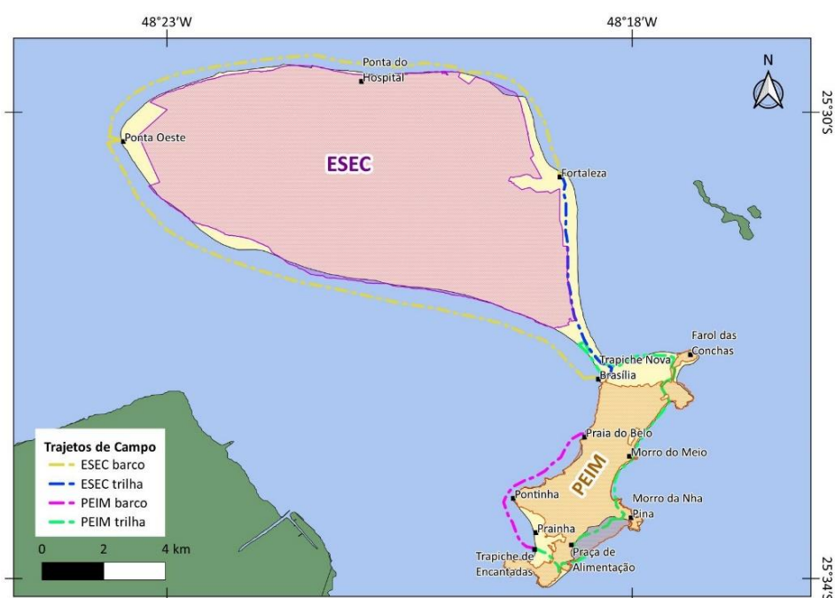
Figura 3: Trajeto realizado nas saídas de campo.

A viabilidade logística do campo foi possível pela proximidade geográfica e espacial do campus CEM com a Ilha do Mel, tornando o acesso facilitado com a utilização de embarcações e marinheiros da UFPR. Assim, para as saídas de campos que objetivaram visualizar in situ a configuração do território Ilha do Mel, suas divisões, usos, interesses e ocupações, duas equipes foram formadas sendo uma delas com destino e foco no entorno da ESEC e a outra para o entorno do PEIM (Figura 3).