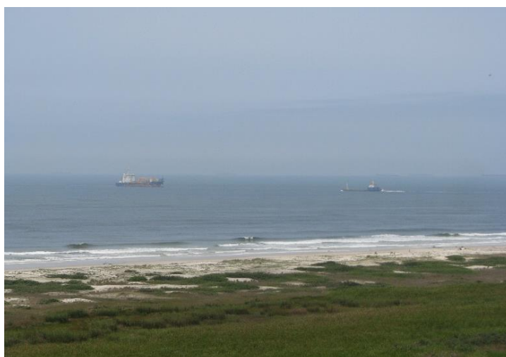
Figura 4: Navios de dragagem em operação.

impactada pela falta de infraestrutura e saneamento básico, representadas pela falta de redes de energia elétrica e água potável na comunidade, por dificultar o processo de sanitização e conservação da produção que possui fins de comercialização. Após o campo, houve tentativa complementar da equipe em realizar entrevista por e-mail com os responsáveis do IAT pela gestão das UCs da Ilha do Mel, porém não se obteve resposta. Ainda, verificou-se nas observações em campo o não cumprimento dos programas ou subprogramas indicados pelo Plano de Manejo vigente.