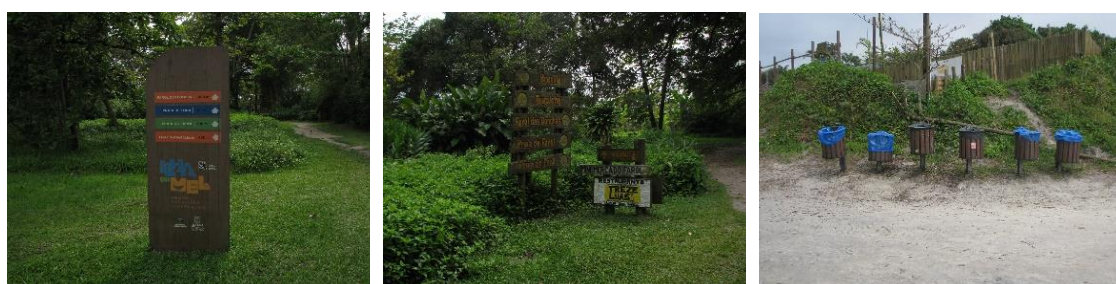
Figura 7: Placas e lixeiras nas proximidades dos estabelecimentos comerciais.

Durante o trajeto, notou-se que lixeiras com sacos de lixo, placas em boas condições de manutenção e pequenos trechos adequados de trilhas estão situados apenas em locais onde há a proximidade e presença de pousadas, restaurantes e comércios destinados ao turismo (figura 7).