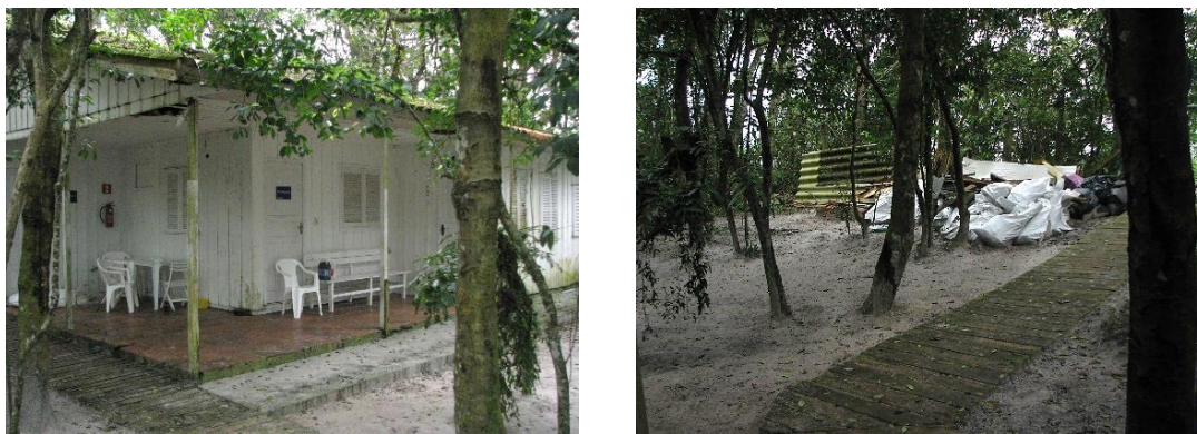
Figura 5: Aspecto da sede do IAT na vila de Nova Brasília na ocasião do campo.