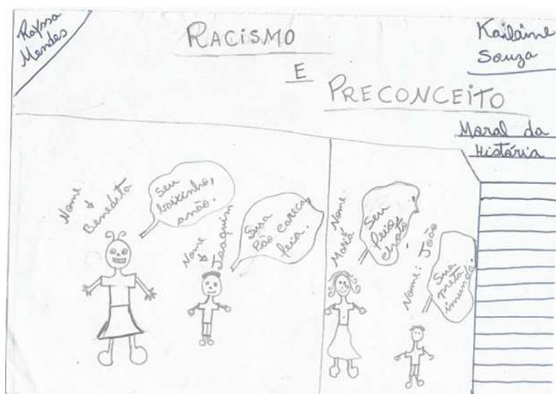
Figura 1. Pré-conceito e racismo