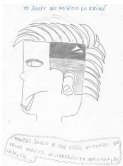
Figura 2. Os jovens no mundo do crime

Com os resultados obtidos podemos ver que ao produzir o quadrinho, os envolvidos inserem-se na construção do saber de maneira democrática, tendo seu sentido assegurado através da relação entre o educador e o educando, formando uma responsabilidade incorporada não apenas intelectual, mas que também permite através